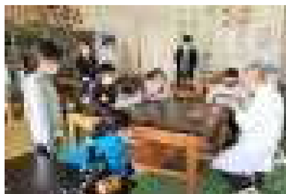
5年生児童会館学習～感染対策ばっちりOK

明日から冬休みとなりますが、1月6日（水）から授業を開始しますので、「冬休み」と言うよりは「お正月休み」といった感じでしょうか。年末年始ホッと一息ついて、3学期に向かう気力と体力を養ってほしいと思います。