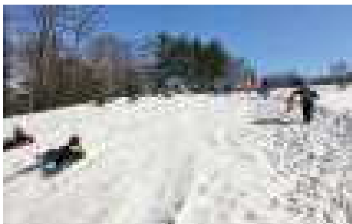
雪遊びの1年生～せっかくの冬、楽しまなくちゃ!

激動の令和3年度をしめくくる(!?) 大雪で高校入試が順延されたり大変でしたが、それでも日差しが春らしく暖かくなってきました。相変わらず心配なのはコロナで、北海道の中でも十勝がとびきりの感染者拡大です。今までの感染対策に、さらに緊張感を持って臨みたいものです。