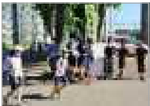
児童会あいさつ運動～今日はロシア語で

夏休み中2週間の登校日、計40時間の授業を児童は大変よく頑張りました。明日からは、